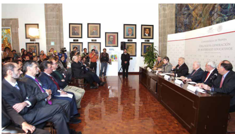
Emilio Chauyffet presenta Nueva Generación de Materiales Educativos.

La SEP realizó la revisión y análisis de los contenidos y metodologías de los libros de texto gratuitos; se llevaron a cabo grupos de enfoque sobre los actuales libros; se desarrollaron nuevas propuestas de materiales en braille y macrotipo,