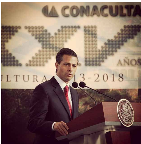
Enrique Peña Nieto.

Puntualizó que para dar soporte al desarrollo cultural en este año, “el Gobierno de la República destina más de 18 mil 300 millones de pesos, monto superior en 600 millones con respecto al ejercido el año pasado”. Gracias a estos recursos, agregó, se entregan anualmente más de cuatro mil 500 estímulos en 32 disciplinas culturales y artísticas, y se cuenta con más de cinco mil 800 millones de pesos para el Programa de Impulso