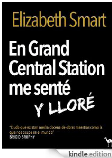
Portada de una de las novelas pirateadas a la venta en Amazon

Sin embargo, y pese a la tan traída y llevada Ley de Propiedad Intelectual, el sector se encuentra con bastantes dificultades para hacer efectivos sus derechos en el mundo digital. A la existencia de numerosos portales que permiten la descarga masiva de libros piratas bajo el amparo de la cultura libre (los propios usuarios se denominan editores, en una falacia tan infinita como el universo